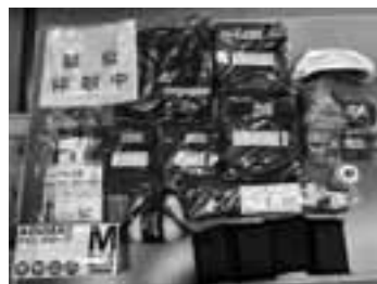
高齢者疑似体験キット

各種福祉用具（車椅子、子供用車椅子、入浴用品等）、高齢者疑似体験キット、輪投げ等の貸出を行っています。お気軽にお問い合わせください。