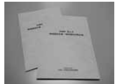
地域福祉活動計画