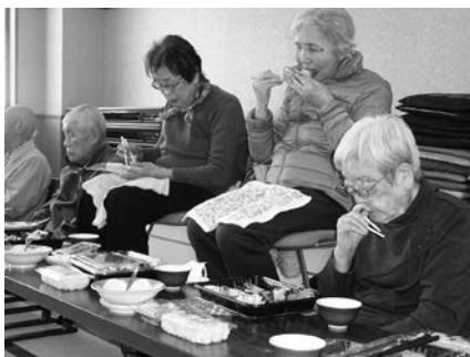
一人暮らし高齢者昼食交流会