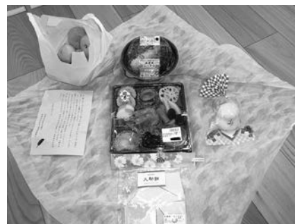
特別給食サービス