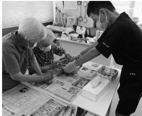
社協デイサービスでの様子

夏休み期間に、河津中学校の生徒53名が町内外の10施設でボランティア活動を行いました。この体験をきっかけに、ボランティア活動に一層興味を持っていただけたらと思います。